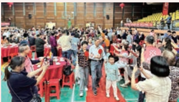
10月10日,鼓楼区锦江社区老体协与多家单位共同举办第十九届老人节暨邻里重阳百家宴活动。