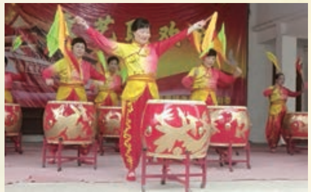
10月2日,福清市新厝镇举办“迎国庆”文艺联欢会。