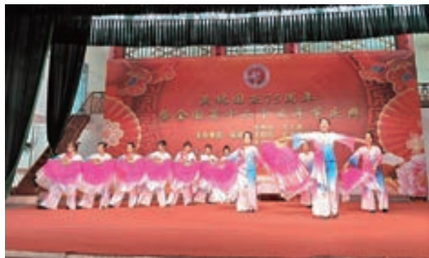
10月5日,东瀚镇老体协举办重阳节文艺表演活动。