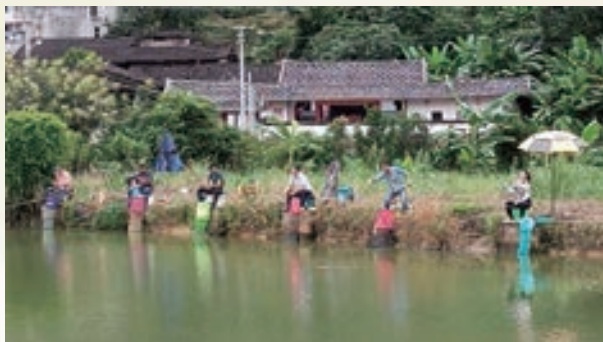
10月6日,永泰县老体协举办2024年“庆国庆”老年人钓鱼比赛。