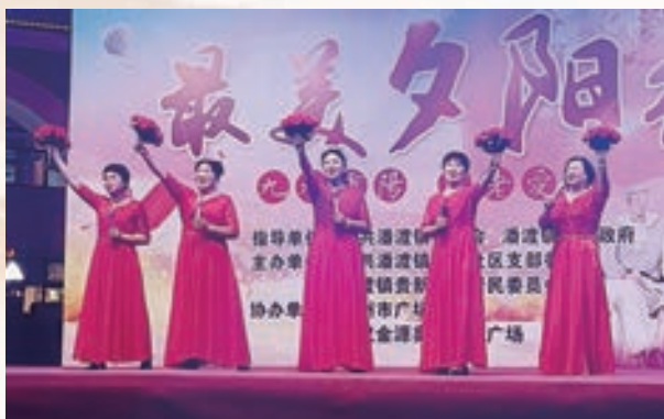
10月11日，连江贵安潘渡镇老体协贵新社区栀子花艺术团举办重阳节文艺晚会。