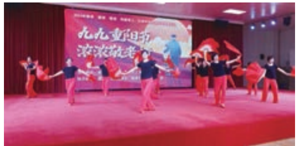
10月11日,福清市卫健系统老体协举办重阳节文艺汇演。