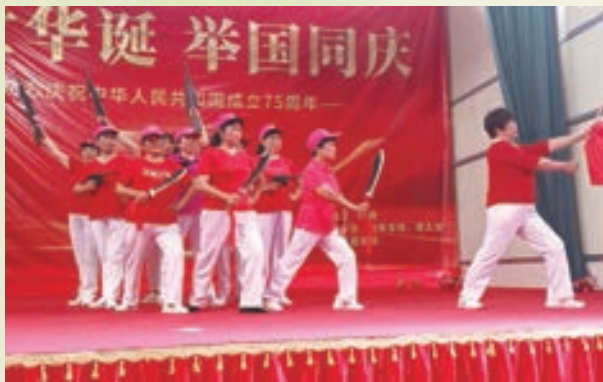
10月1日,闽清县金沙镇举办“喜迎国庆,祝福祖国”活动。