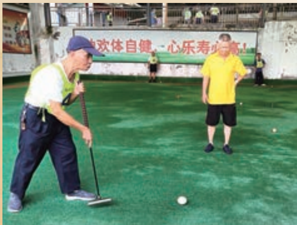
9月27日至29日,永泰县老体协举办“庆国庆”门球比赛。