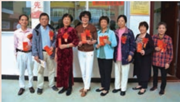
重阳期间，长乐区直机关老体协开展慰问活动，为协会高龄老人发放敬老月慰问金。