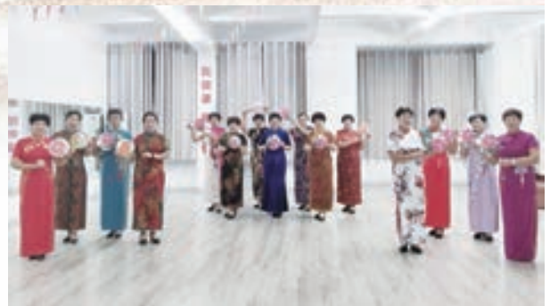
10月8日,龙田镇老体协靓丽旗袍队举办重阳节旗袍走秀活动。

重阳节期间,福清市老体协系统举办系列主题活动,欢度重阳,营造欢乐祥和、文明健康的节日氛围。