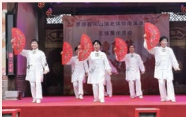
10月7日,罗源县凤山镇老体协南溪辅导站举办重阳节文体展示。