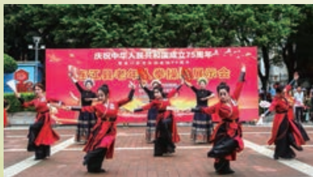
9月28日，连江县老体协举办“迎国庆”老年人拳操舞展示会。