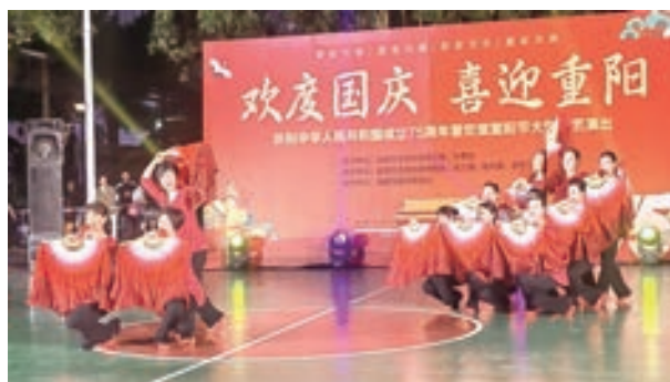
10月11日,玉屏街道老体协举办“欢度重阳节”大型专场文艺晚会。