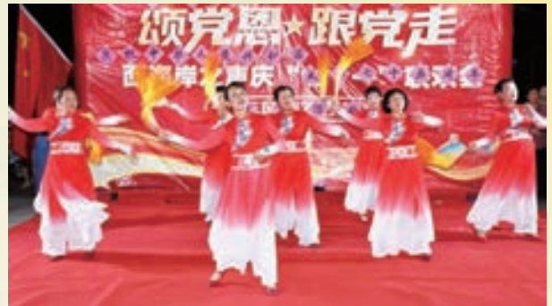
10月1日,闽侯县老体协甘蔗街道辅导站参加“盛世华诞 祝福祖国”文艺汇演。