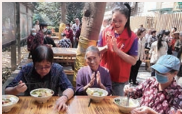
10月11日,晋安区老体协持杖健走辅导站开展“巾帼敬老 爱在重阳”文明实践活动。