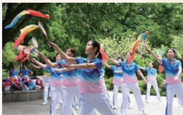
9月30日,鼓楼区老体协西湖柔力球辅导站举办“迎国庆”主题活动。