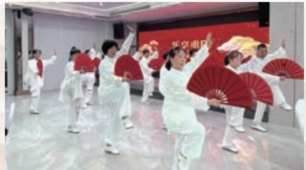
10月11日，台江区老体协鳌峰街道辅导站举办“乐享重阳 福满金秋”主题活动。