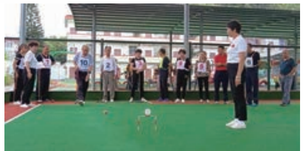
10月10日,宏路街道举行“庆重阳”地掷球交流活动。