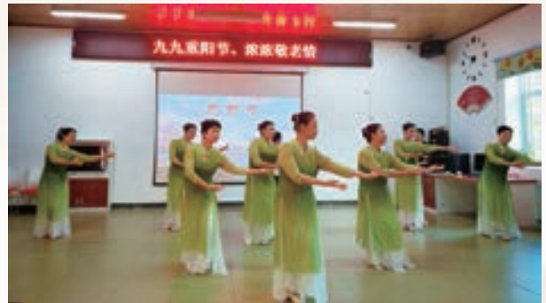
10月11日，永泰县举办2024年“九九重阳节 浓浓敬老情”文体联欢活动。