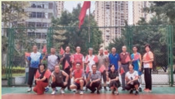
10月1日,罗源县老体协闽星气排球队举行升国旗唱国歌仪式。