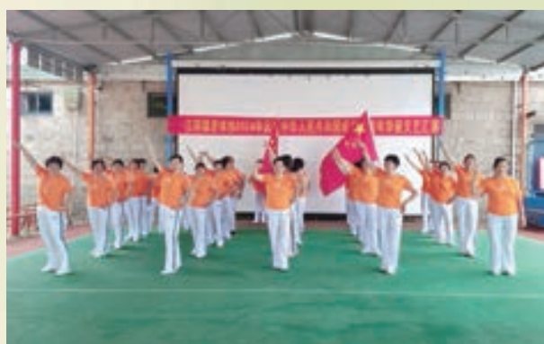
9月30日,福清市江阴镇老体协举办“迎国庆”文艺汇演。