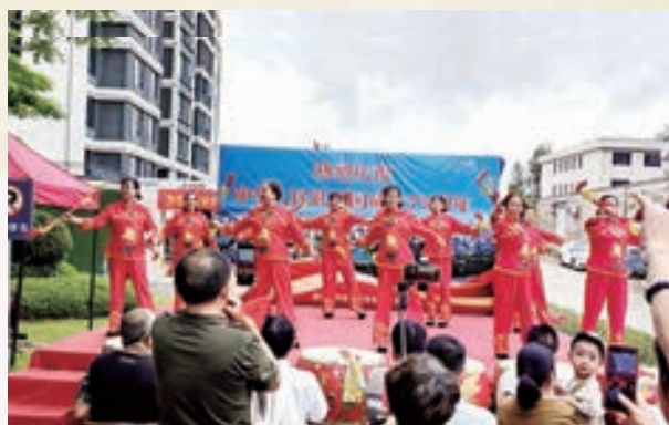
10月1日,闽侯县老体协竹岐辅导站举办国庆节庆典活动。