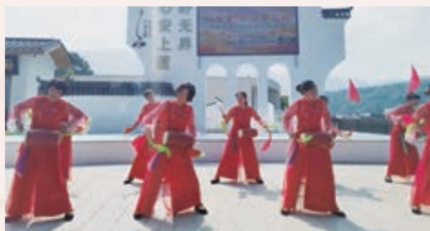
10月11日,闽清县上莲乡老体协举办“欢度重阳 共享天伦”文体展示活动。