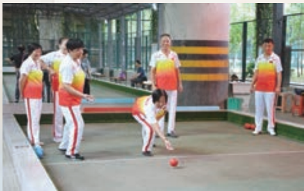
9月26日,长乐区直机关老体协举办“迎国庆”地掷球友谊赛。