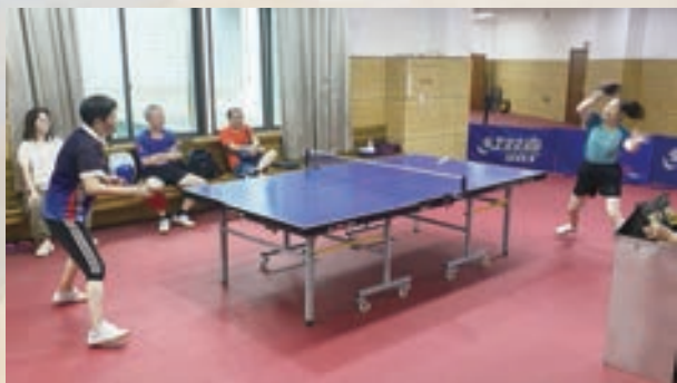
9月27日,晋安区老体协举办2024年老年人“迎国庆”乒乓球交流活动。