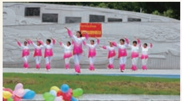
10月11日,市直机关老体协养生武舞专委会开展“迎国庆”活动。