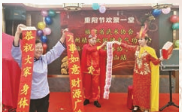
10月15日，市直机关老体协于山十三站举办重阳节活动。