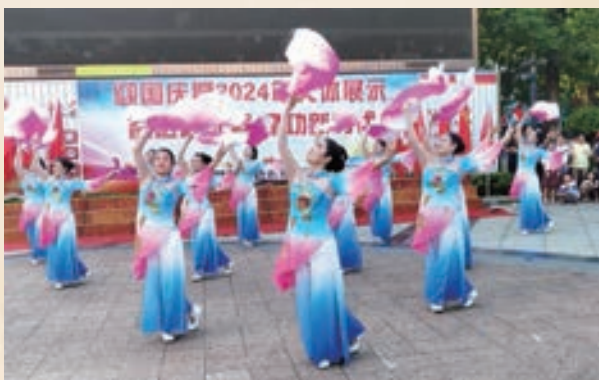
9月28日,罗源县凤山镇老体协举办2024年“迎国庆”文体展示。