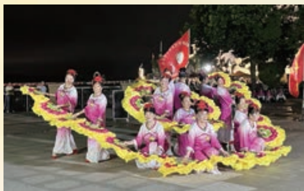
9月29日,马尾老体协沿山社区辅导站举办“迎国庆”文艺晚会。