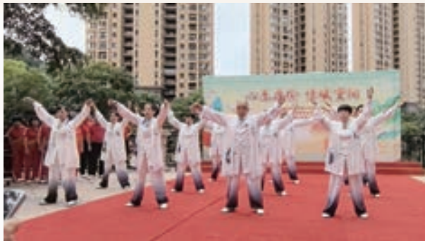
10月11日，仓山区老体协淮兴社区聚缘太极队参加“心系桑榆 情暖重阳”文艺汇演。