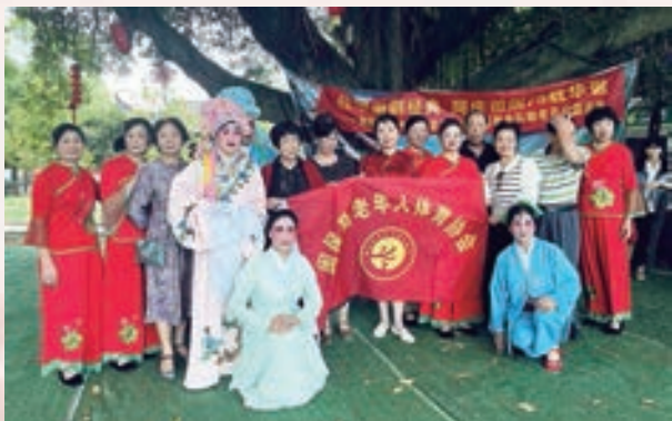
重阳节期间,闽侯县老体协与多家单位联合举办多场敬老月志愿服务活动。