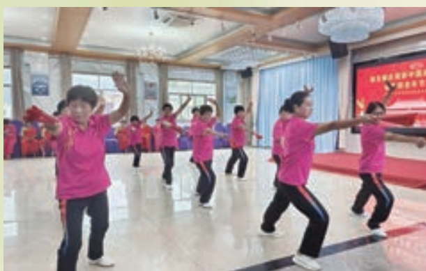
9月29日，闽清县坂东镇举办庆祝新中国成立75周年文体展演。