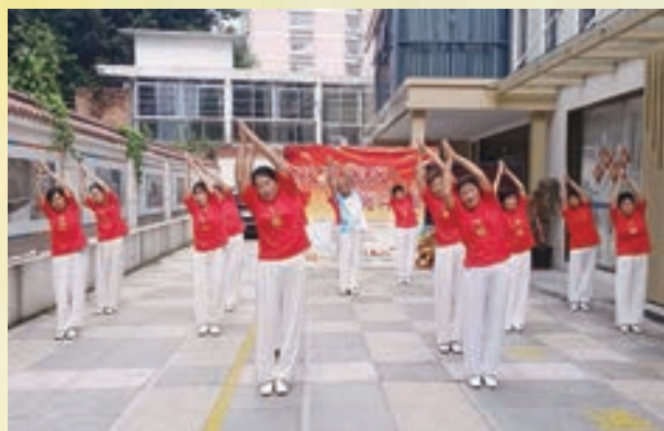
9月29日,市直机关老体协白马河公园活动站20名队员参加南街街道“欢度国庆,共赏华章”活动。