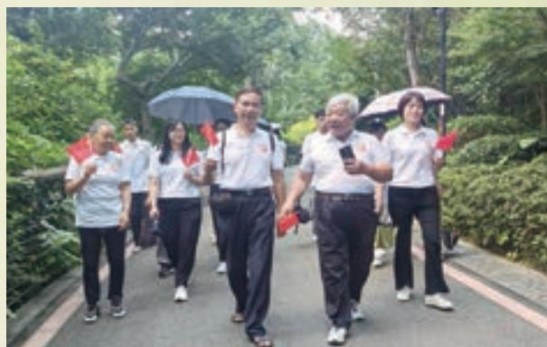
9月29日,鼓楼区北江社区老体协举办“健步行庆国庆 民族团结共奋进”活动。