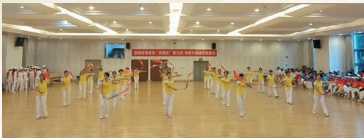
9月29日，鼓楼区老体协举办“庆国庆”柔力球、有氧行进操交流展示活动。