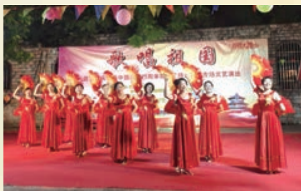
9月30日，台江区宁化街道健身辅导站参加“迎国庆”激情广场大家唱专场文艺演出。