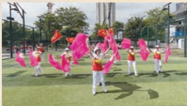
9月28日,马尾老体协举办社区辅导站“迎国庆”歌舞展示活动。