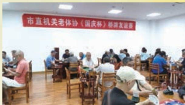
9月28日至29日，市直机关老体协举办“国庆杯”桥牌友谊赛。