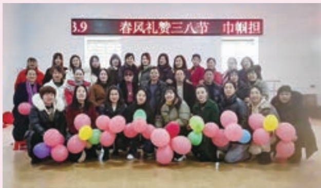
3月9日，福清市三山镇老体协举办“庆祝三八节”系列活动。