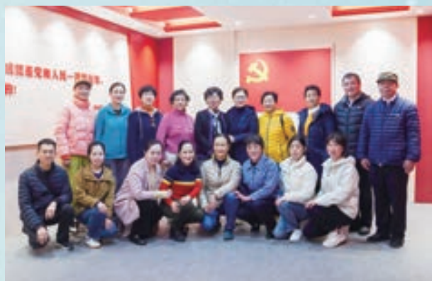
3月7日，市直机关老体协市公安局辅导站开展主题党日活动。