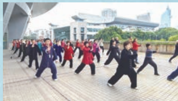
3月9日，鼓楼区老体协武云太极健身辅导站开展新春太极健身首秀活动。