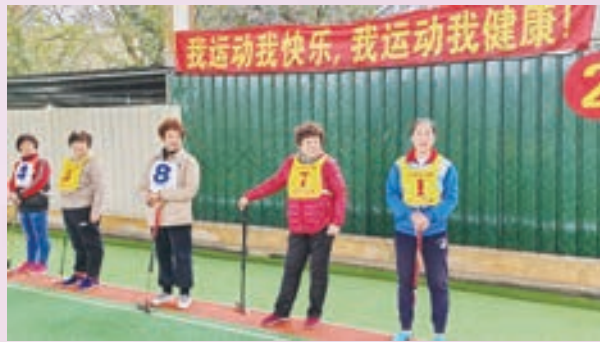
3月6日,仓山老体协门球专委会举办“庆三八妇女节”门球交流赛。