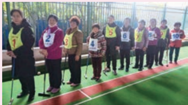
3月7日，连江县老体协举办“庆三八”妇女门球交流活动。