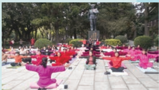
3月5日,市直机关老体协健身气功专委会举办“学雷锋·十二段锦送春风”活动。