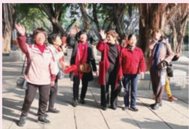
3月8日，晋安区直老体协开展“庆三八”健步行活动。