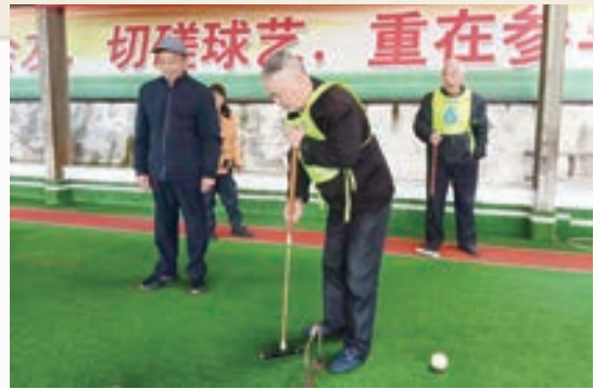
3月7日，永泰县城峰镇南城 区塔山老体协举办拗九主题门球交 流活动。