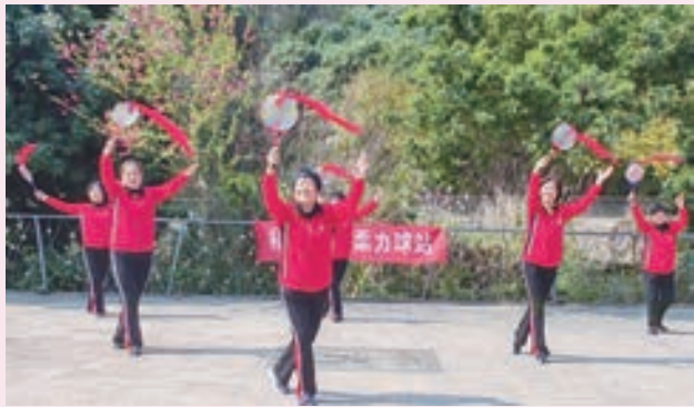
3月8日，鼓楼区老体协西湖柔力球站在森林公园桃花园欢庆“三八”节。