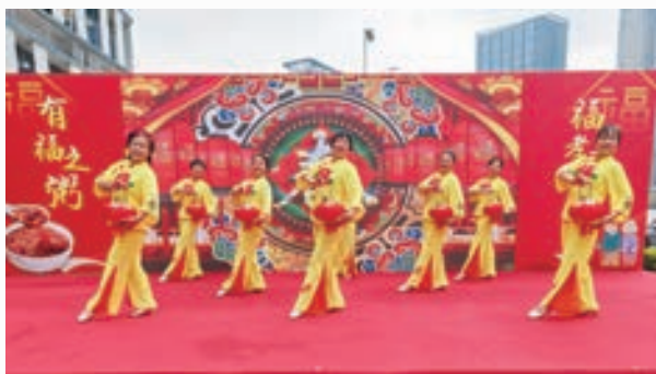
拗九节期间，台江区老体协发 动各社区健身辅导站(点)，参与拗 九节主题活动，展现老体协风采。