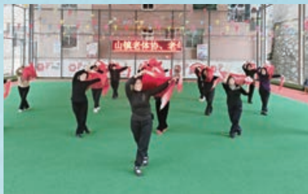
3月8日，福清市高山镇老体协举办秧歌《九儿》培训班。