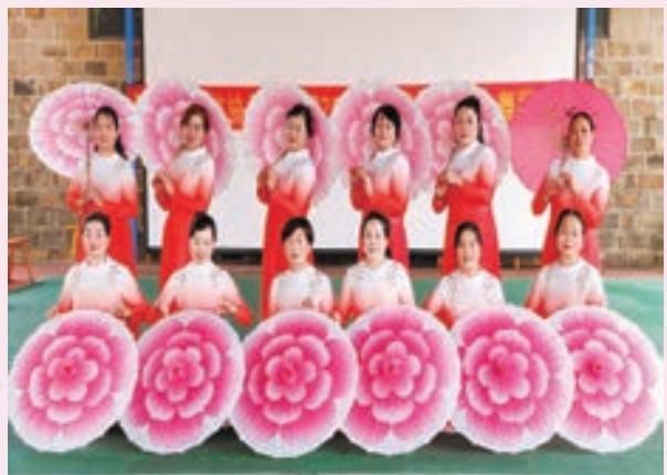
3月8日，福清市江阴镇老体协举办庆祝“三八”妇女节文艺活动。