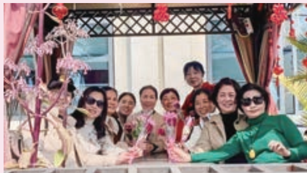
3月8日，马尾区船政社区辅导站广场舞队欢度“三八”国际妇女节。