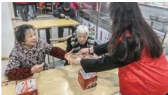
3月9日，长乐区吴航街道老 体协开展“拗九浓情颂德孝，福 ‘粥’飘香暖万家”主题活动。