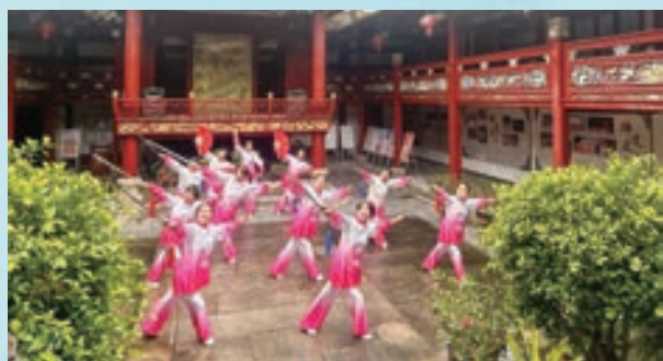
3月14日，鼓楼区安泰街道中心辅导站开展“古月派·武舞养生”推广活动。