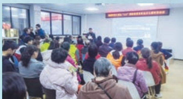
3月15日，台江区老体协举办福建科普大讲坛3·15国际消费者权益主题科普活动。