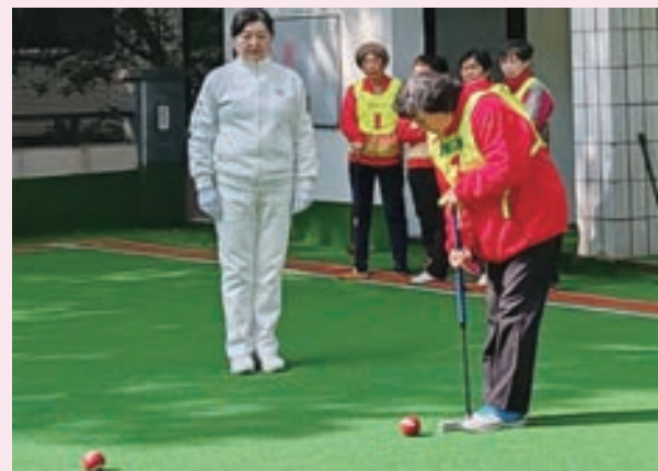
3月8日，鼓楼区老体协举办“三八节”女子门球联谊赛。