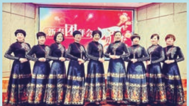
3月5日,罗源县凤山镇老体协罗川歌友会举办春节团拜会。