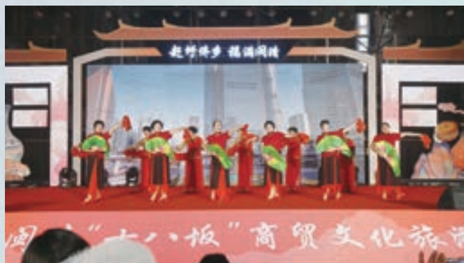
2月27日,闽清县坂东镇老体协组织歌舞爱好者参加“十八坂”百姓大舞台文艺演出。