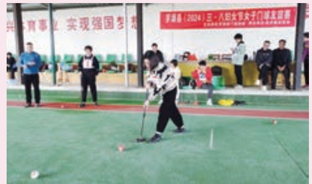
3月8日，罗源县在上长治村举办“三八国际妇女节”门球友谊赛。