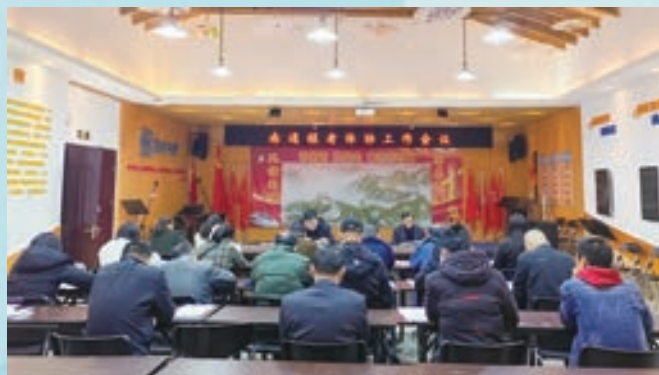
3月4日,南通镇老体协在镇老体活动中心召开2024年工作会议。