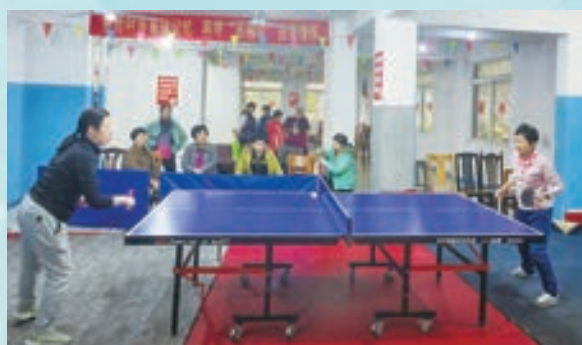
3月8日，鼓楼区五凤街道老体协举办第二届“光大杯”乒乓球比赛。