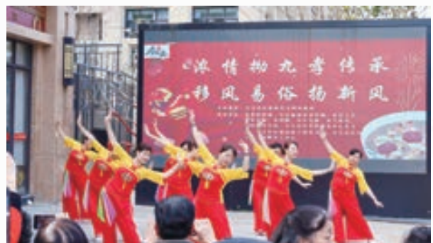
3月7日，福清市龙江街道天 宝社区老体协文体展示庆拗九。