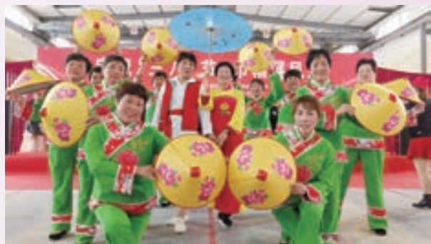
3月6日,闽清县坂东镇举办“情暖三八节,巾帼绽芳华”文艺展演。