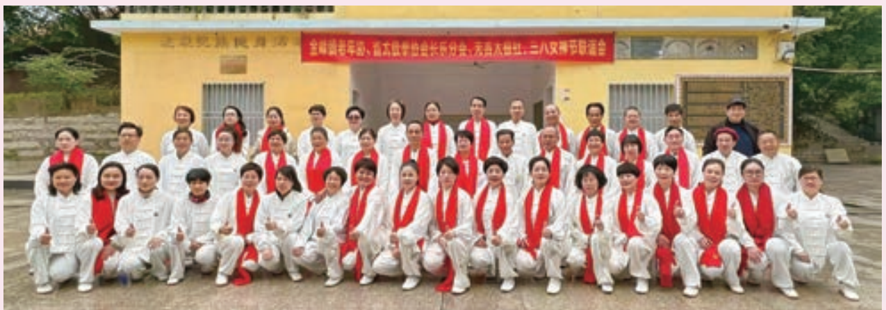
3月9日，长乐区金峰镇老体协举办“庆三八”联谊活动。