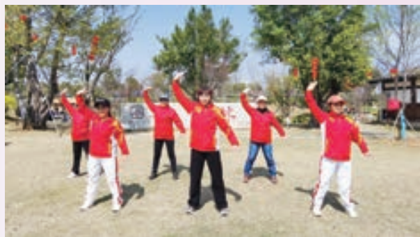
3月3日,市直机关老体协体育馆辅导站组织“庆三八”踏青展示。

“三八”国际妇女节期间,福州市各级老体协开展丰富多彩的主题活动,营造浓厚的节日氛围,女同胞们度过了一个丰富多彩、意义非凡的专属节日。