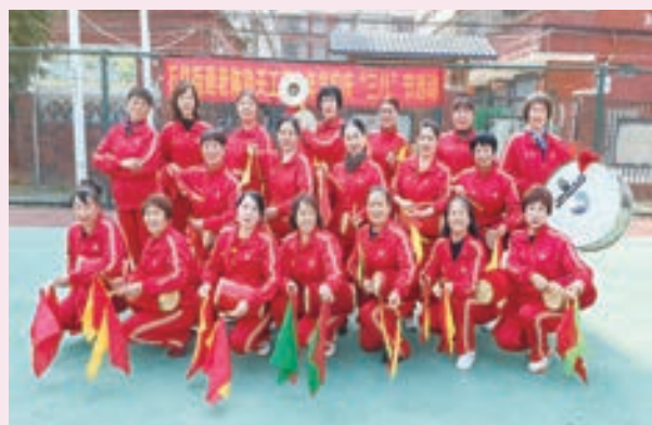
3月8日，福清市石竹街道老体协举办“庆三八”柔力球展示活动。