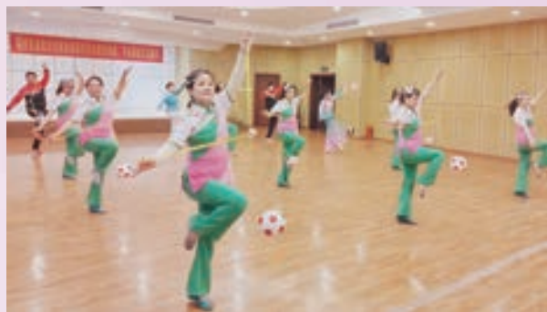
3月6日,市直机关老体协球操专委会举办“三八节”健身交流展示。