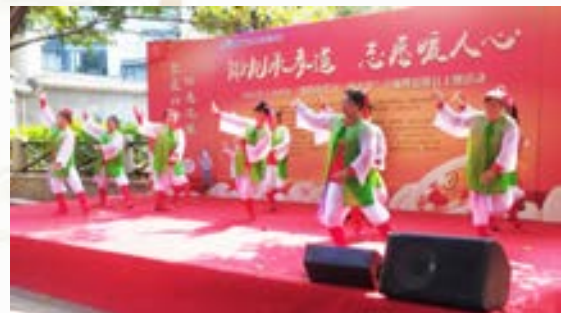
3月5日，市直机关老体协于山 总站参加于山社区“我们的节日·拗 九节”专场暨雷锋日主题活动。