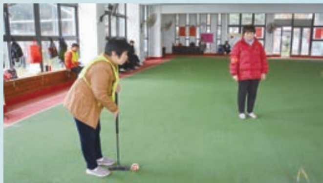
3月2日,长乐区老体协门协举办新春首场门球友谊赛。