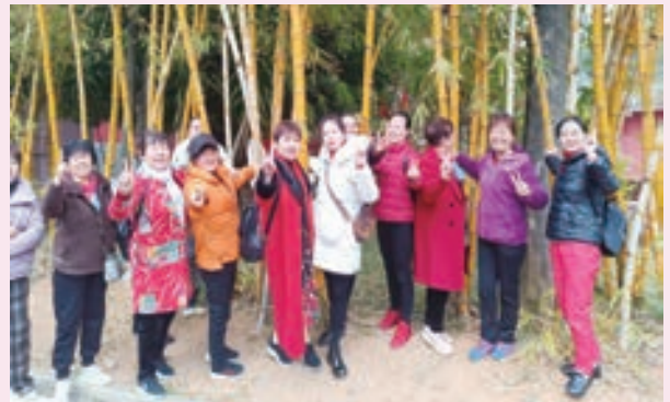
妇女节期间，台江区老体协鳌峰街道辅导中心站开展户外健身活动。