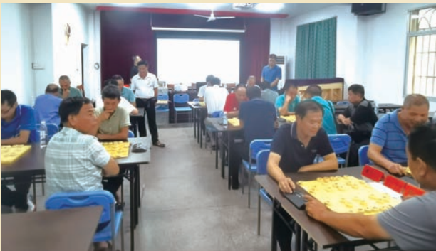
9月27日,闽清县老体协举办第八届老健会“迎国庆”象棋比赛。