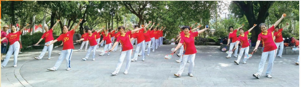
9月28日,市直机关老体协西湖柔力球辅导站开展“迎国庆”展示活动。