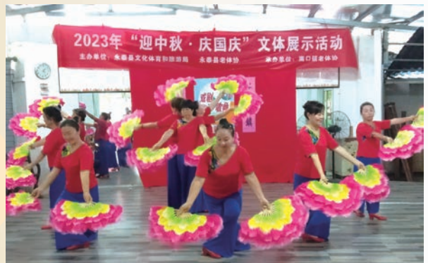
9月28日,永泰县嵩口镇老体协举办“迎中秋 庆国庆”文体展示活动。