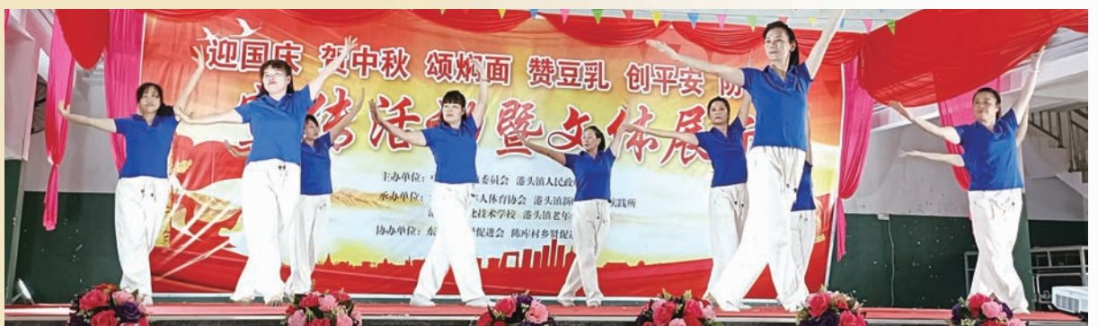
9月28日,福清市港头镇举办“迎国庆 贺中秋”文体展示活动。