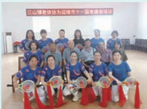
三山镇柔力球培训