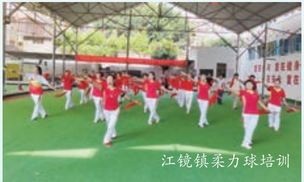
江镜镇柔力球培训