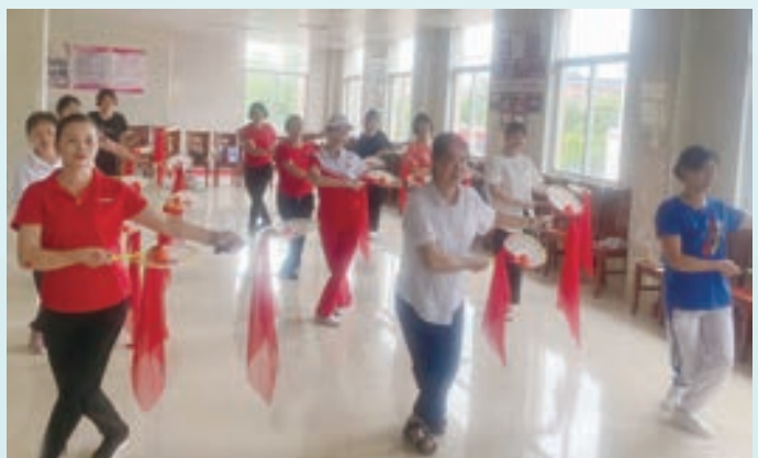
海口镇柔力球培训