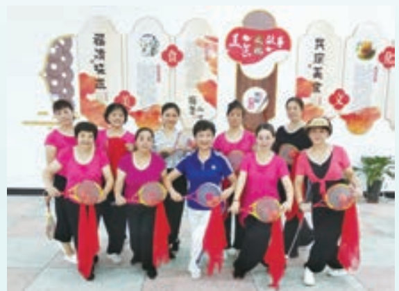
音西街道柔力球培训