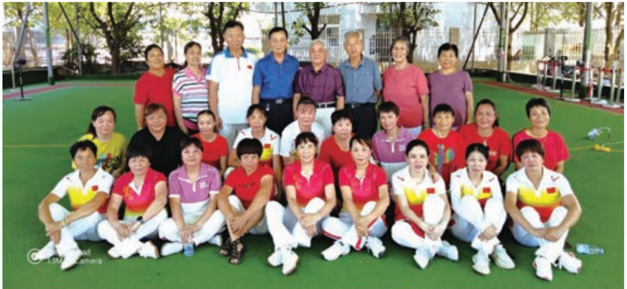
镜洋镇操舞《时代感》培训班