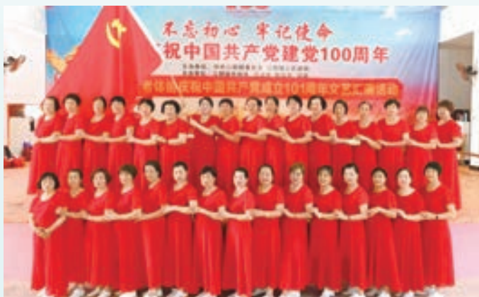
江阴镇庆“七一”文艺汇演