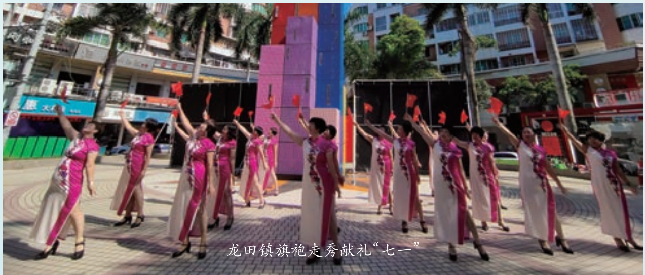
龙田镇旗袍走秀献礼“七一”