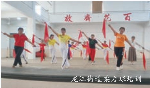
龙江街道柔力球培训