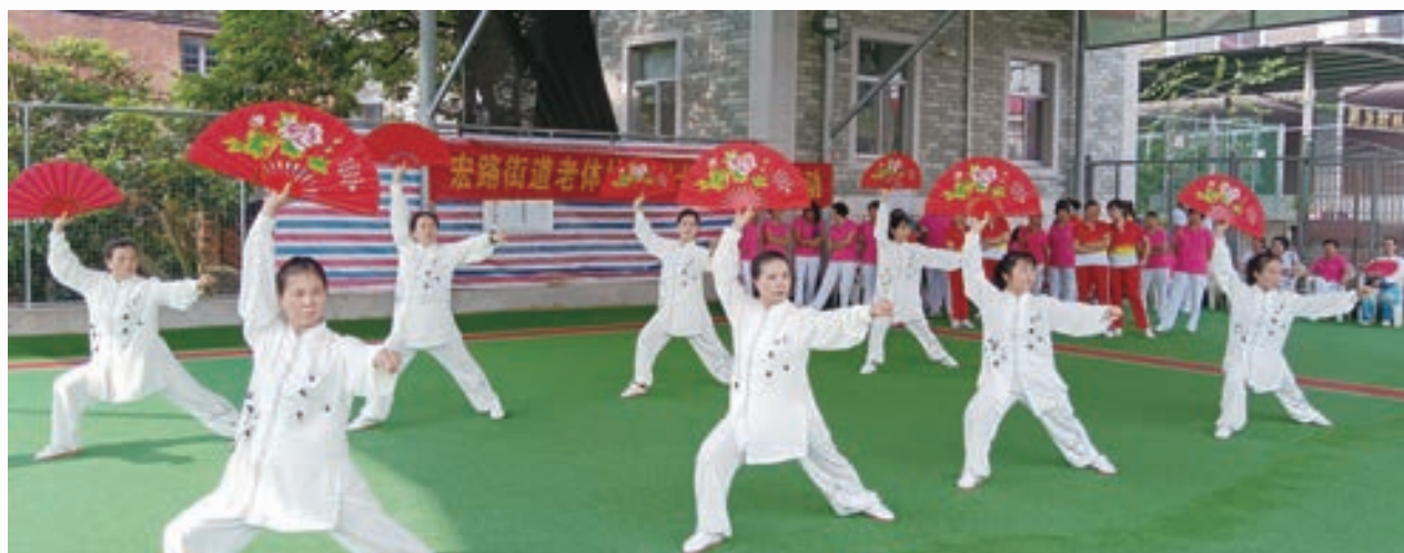
宏路街道庆“七一”太极展示