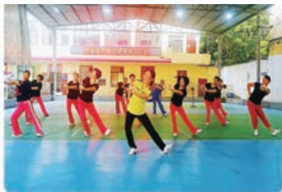
渔溪镇健身球操培训

七月，福清市各级老体协举办了形式多样、丰富多彩的老年文体活动。他们在用自己的独特方式庆祝中国共产党成立101周年的同时，也为第十一届福清市老年人健身大会的举办做好准备。