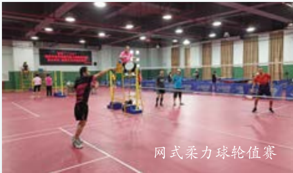
网式柔力球轮值赛