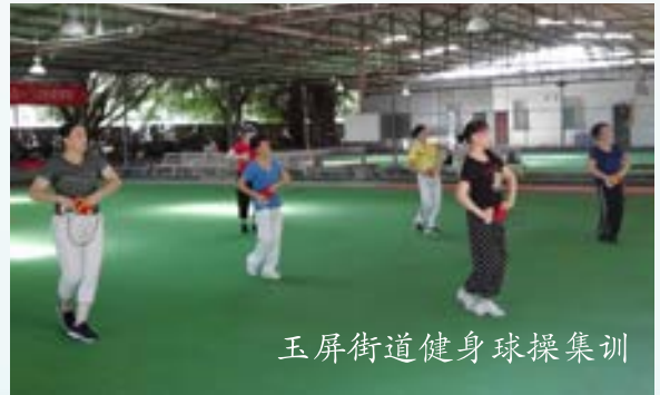
玉屏街道健身球操集训