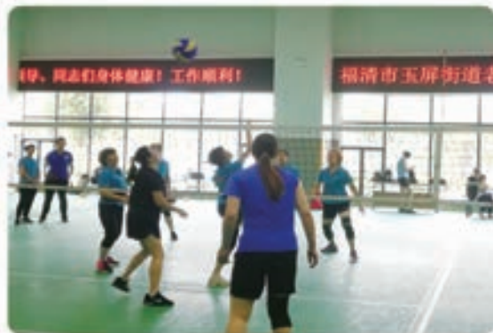
玉屏街道气排球邀请赛