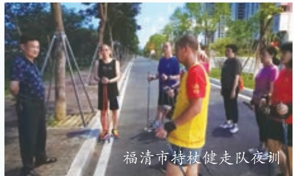
福清市持杖健走队夜训