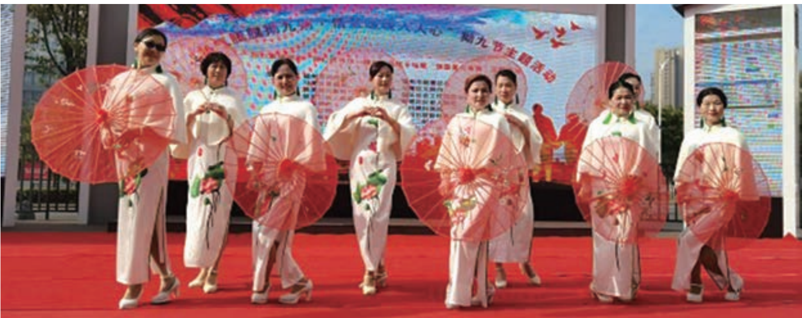
马尾芳华时尚走秀队参加新港社区拗九节系列活动 (吴星)

3月1日，闽清县金沙镇拗九节活动现场暖意融融，来自各村居的老年人代表、退休干部、教师、工人、农民一同观看了以各村居老体协、老年学校学员为主的文体展示表演。