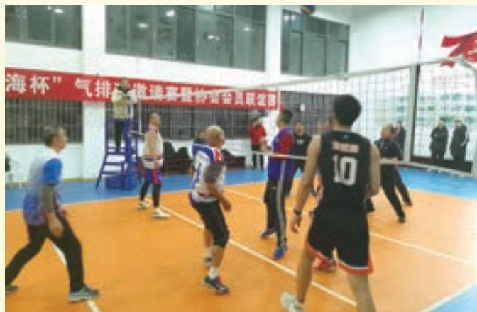
2月11日至16日罗源县举办2022年“博海杯”气排球邀请赛。