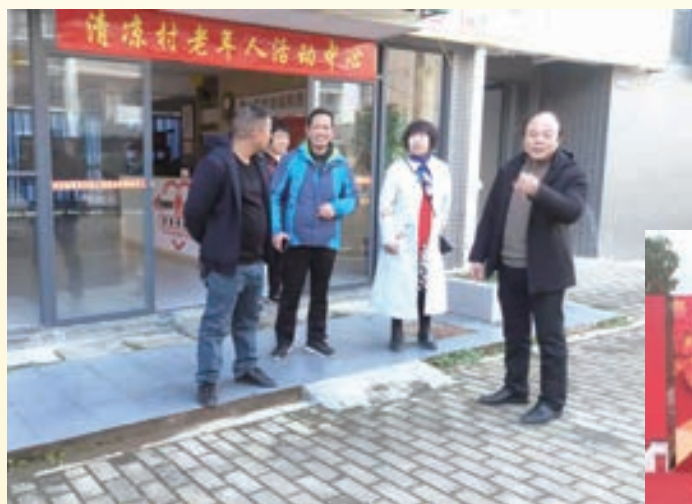
2月25日，永泰县老体协深入清凉镇调研老年人健身康乐家园创建工作。