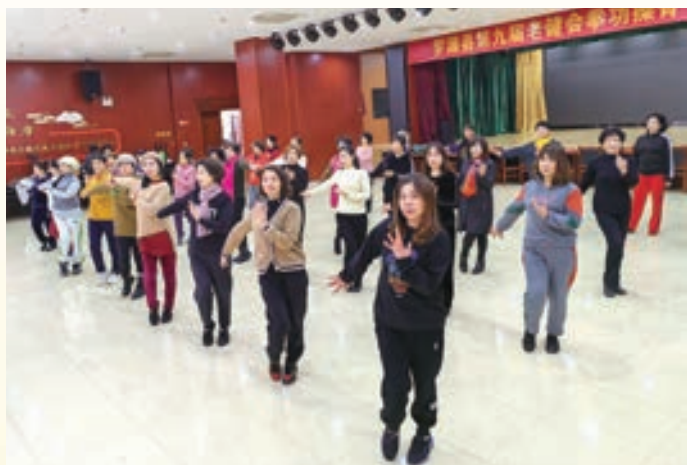
2月19日至20日,罗源县老体协举办广场舞骨干培训班。