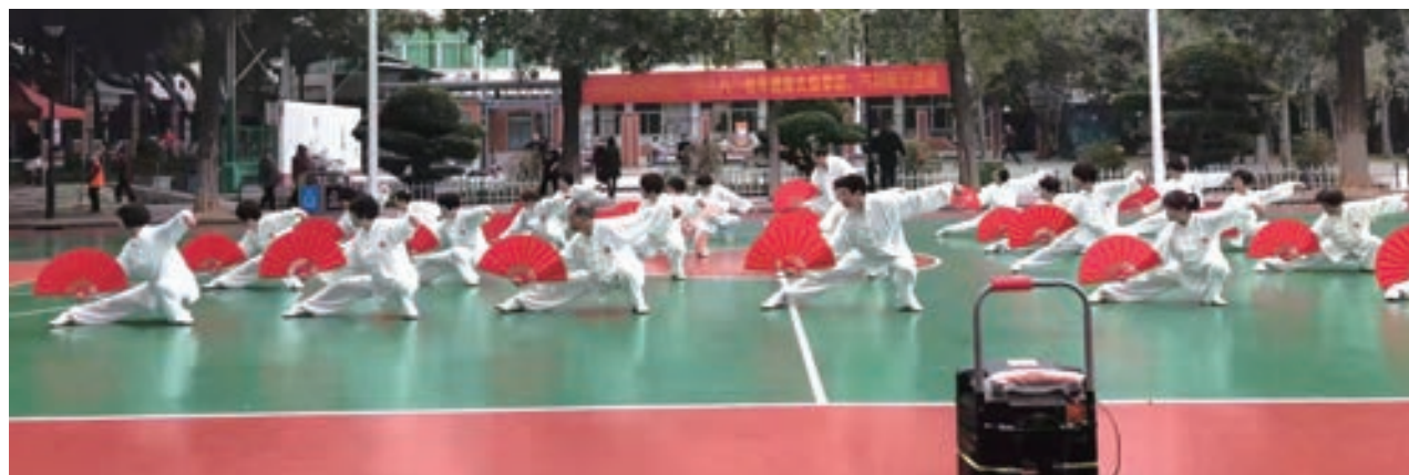
玉屏街道“迎党的二十大、庆三八妇女节”大型群众性太极展示