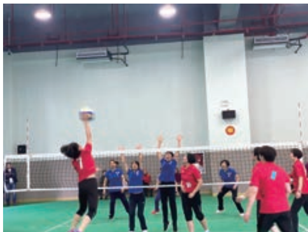
福清市第七届“巾帼杯”气排球赛