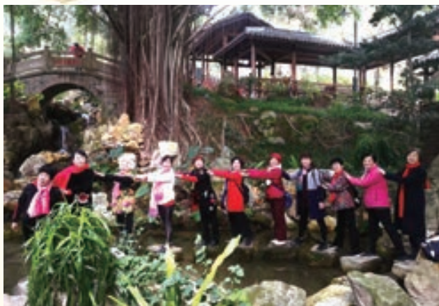
2月16日,市直机关老体协白马河活动站组织游览仓山烟台山公园健步行活动。