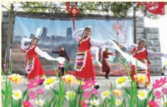
2月12日,闽侯县甘蔗街道老体协举办“欢欢喜喜闹元宵 八闽首邑展新姿”文体活动。