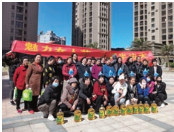
高山镇趣味运动会