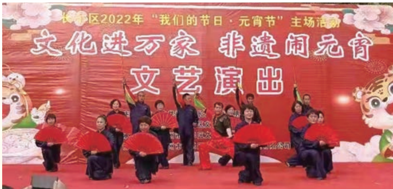
2月15日至16日，长乐金峰老体协才艺表演队开展非遗宣传演出。