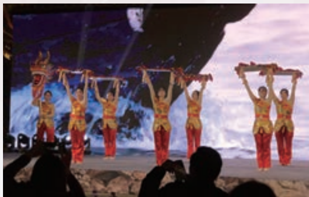
1月26日,马尾区老年健身队参加《有福之州,福见马尾》慰问演出。