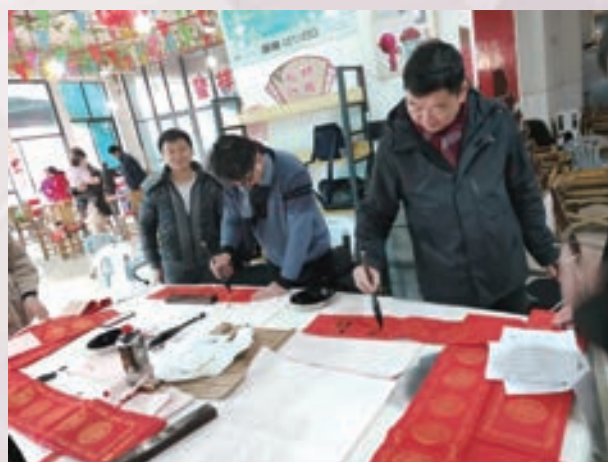
虎年前夕,台江区鳌峰小区举办为小区居民义务写春联活动。