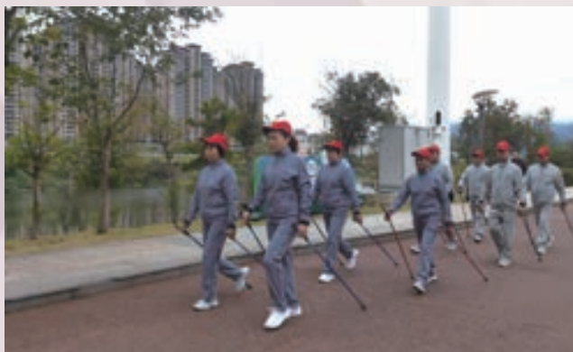
1月17日，永泰旗山社区老体协持杖健走队开展持杖健走训练。