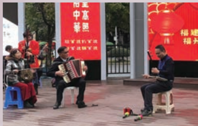
1月18日，马尾区新港社区老年健身队在中环广场开展文艺宣传演出。