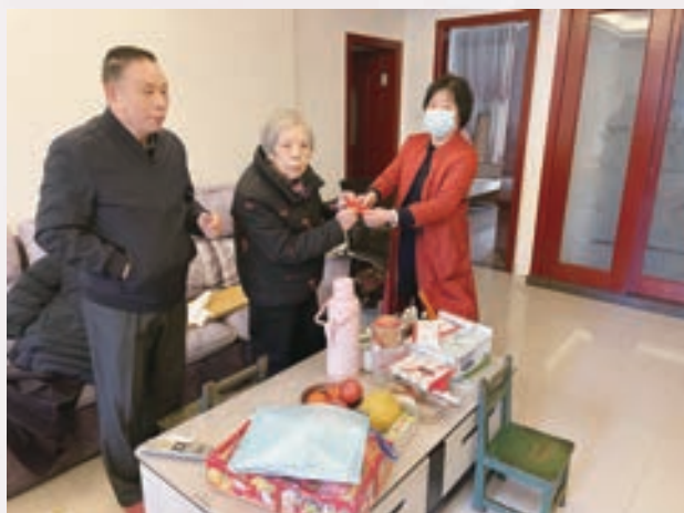
1月19日至20日,罗源县凤山镇老体协开展春节慰问活动。