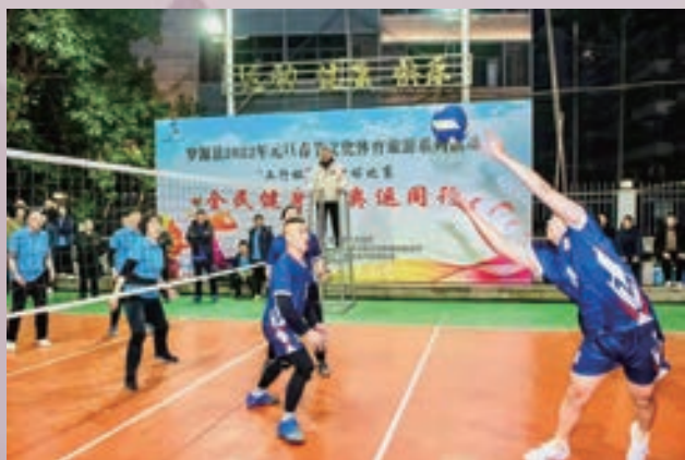
1月7日至15日，罗源县举办2022年元旦春节全民健身气排球赛。