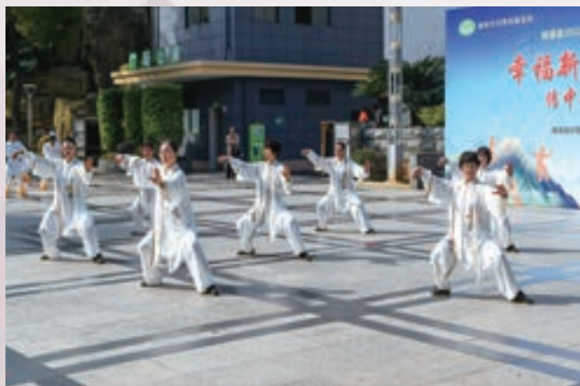
1月19日，闽清县举办“传中华文化，展太极风采”迎新春太极拳比赛。