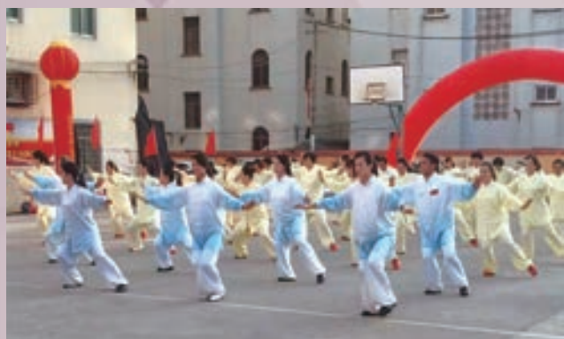
1月15日，福清市港头镇光辉村举办太极拳三周年庆年会。