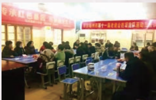
1月22日,福清市玉屏街道老体协举办迎新春座谈会。