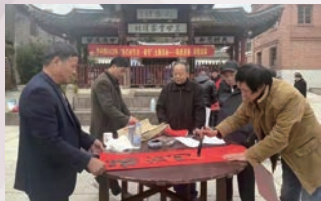
1月19日至20日，闽侯县南屿镇老体协开展“瑞虎迎春 春联送福”义务写春联活动。