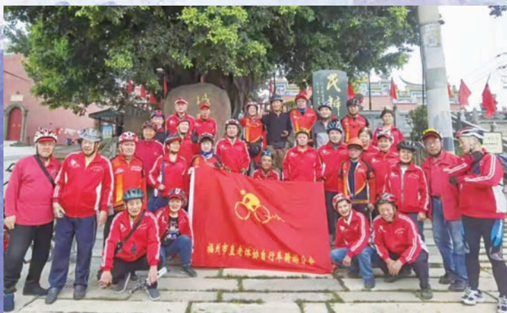
3月27日,福州市直机关老体协骑游分会举办第29届工作会议暨骑游摄影展。