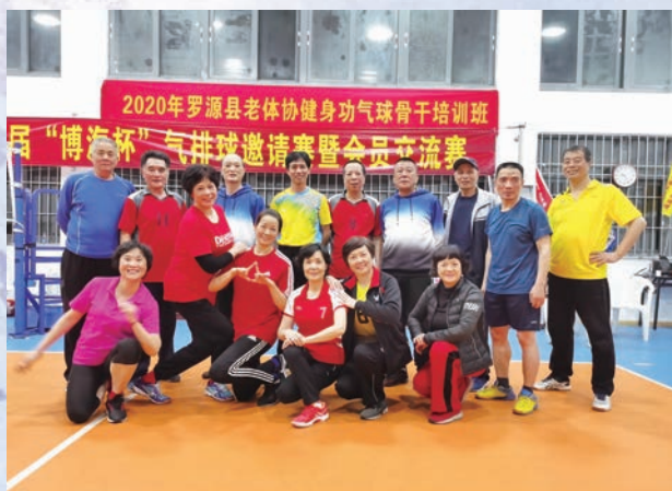
4月10日至13日,罗源县举办第三届“博海杯”气排球邀请赛。