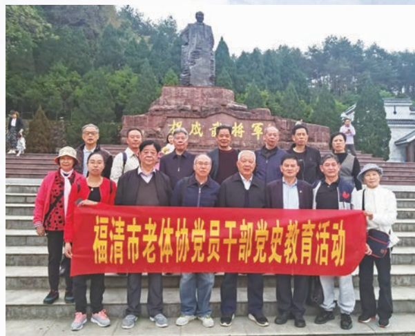
3月底,福清市老体协组织班子成员赴瑞金、长汀、古田等红色革命圣地参观学习,深入开展党史学习教育活动。