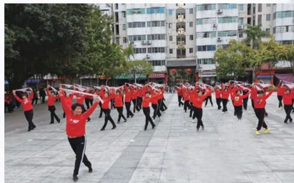
4月9日，罗源县凤山镇老体协开展“共筑百年庆 红歌大家唱 凝聚邻里情”活动。