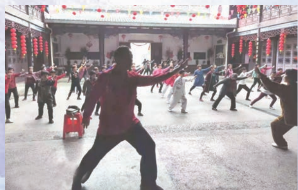
4月7日，闽清县坂东镇举行健身气功易筋经展演。