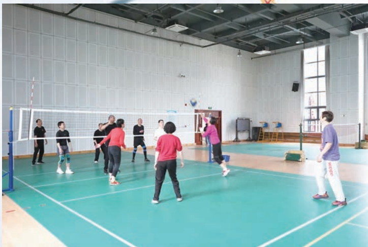
4月9日,福州市公安局退休干部气排球队开展首次集训。