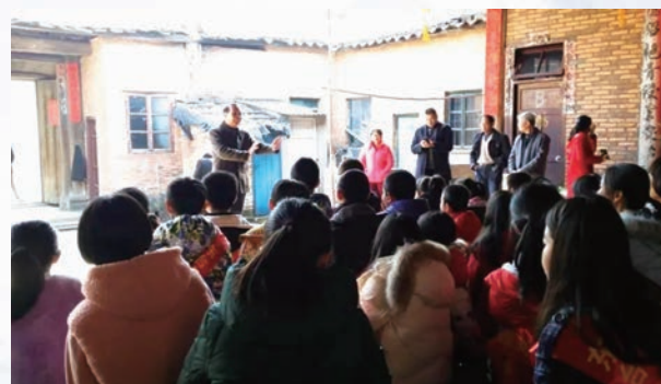
4月13日，闽侯县青口镇老体协举办南阳顶的红色故事宣讲活动。