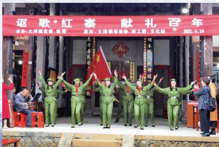
4月14日，永泰县大洋镇老体协举办“讴歌红寨、献礼百年”主题系列活动。