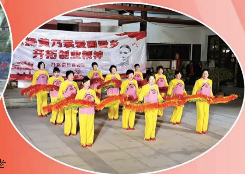
1月1日,闽清县坂东镇溪西村举办“庆元旦迎新春”歌舞联欢晚会。