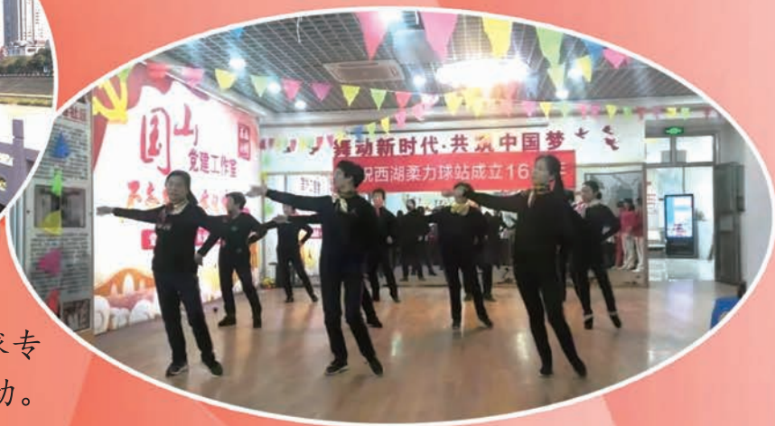
西湖柔力球站举行成立16周年年会及文艺展演。