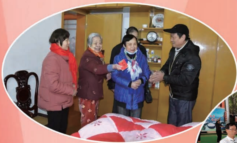
1月8日至10日,长乐区直老体协开展新春走访慰问活动。