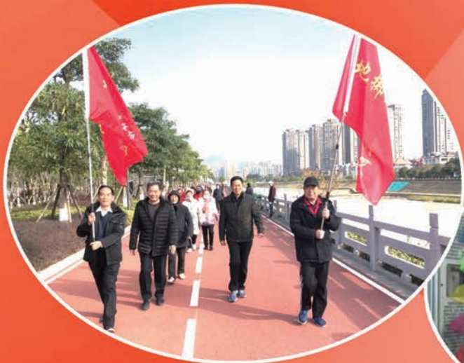
1月1日,福清市老体协地掷球专委会开展庆祝2021年元旦系列活动。