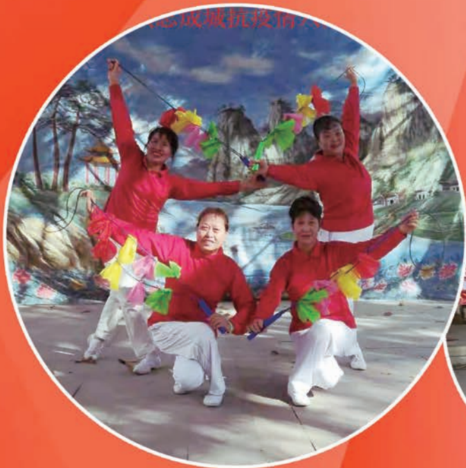
1月31日,闽侯县甘蔗街道老体协举办“众志成城抗疫情 八闽首邑展新姿”文体艺术展示活动。