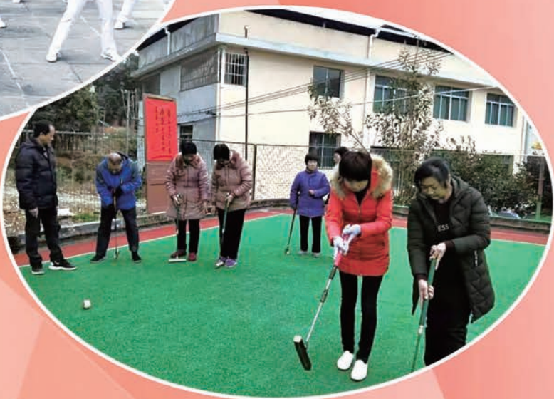
1月11日,金沙镇老体协开展门球训练。