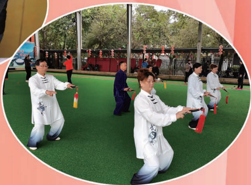
仓山区老体协举办太极拳剑培训。