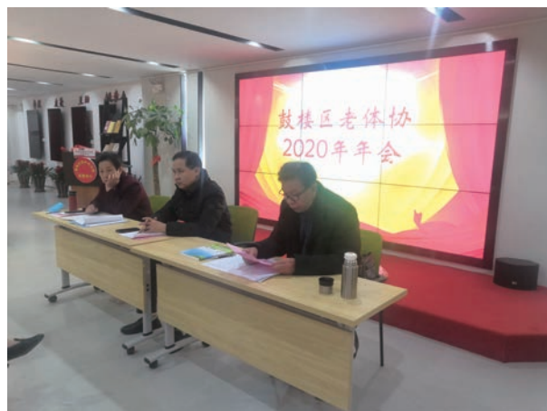
(供稿:鼓楼区老体协 王孝铨)

展丰富多彩的老年人文体健身活动,积极参与市老体协举办的“百年辉煌”文艺展演和庆祝建党100周年书画摄影展,展示老年体育事业发展丰硕成果和老年群众健康幸福的精神风貌。