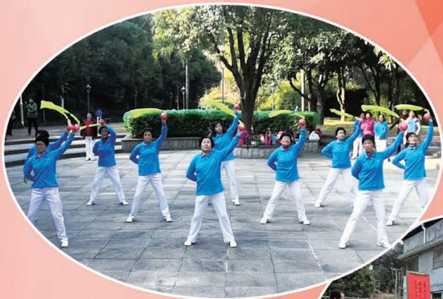
1月6日,市直老体协柔力球分会举行18周年庆祝会。