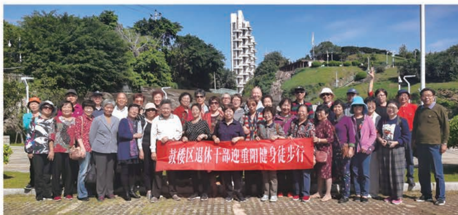
鼓楼区直机关干部退休协会组织开展 重阳健身徒步行活动