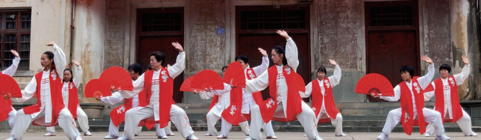
永泰县老体协举办 2020 年“老年节”永泰县太极系列展示活动