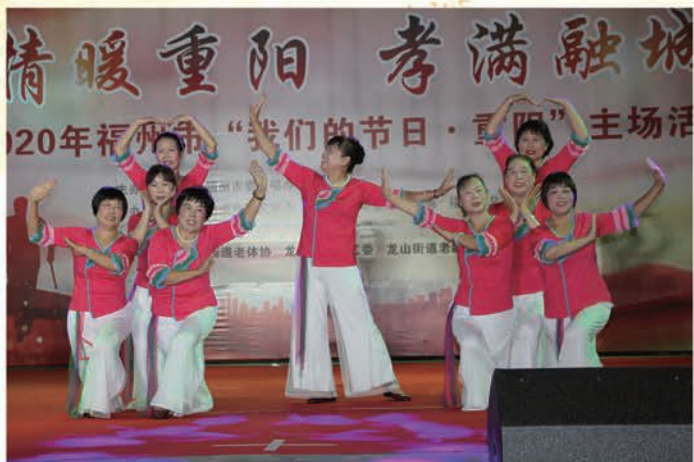
福清市举办“情暖重阳 孝满融城” 联欢活动